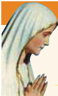
Notre Dame de Fatima