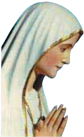
Notre Dame de Fatima